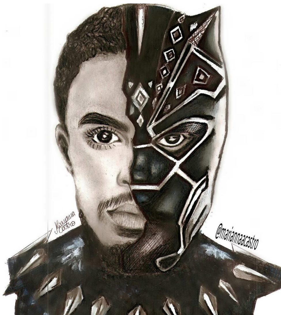
Imagem retirada da internet em 08.03.2018